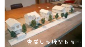
完成した模型たち...