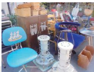
写真は初回開催時のものです

ガレージセールと冬ごもりにピッタリのワークショップ (詳細はHP・Facebookをご覧ください)