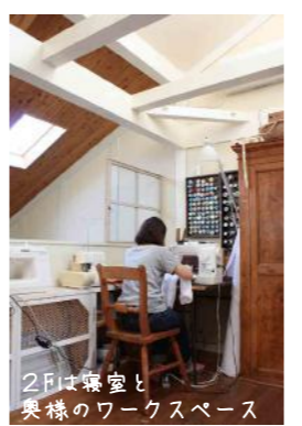
2Fは書斎と奥様のワークスペース

「そういえば建った時は上の子が3歳だった！」と。建った当時はナチュラルテイストだったお家も、子供の成長や、暮らして行く中で変わる好みに合わせて自分達でテイストを変えられていました。梁や柱は白ですっきりと、キッチンや玄関の天井を茶色に塗装したりと普段何気なく居る場所も雰囲気を変えて。カッポットを箱型からシンプルなアイアンの棚受けを付けたものへ...など、テイストにこだわらず自分好みに変えていけるのが木のお家の素敵なところ。