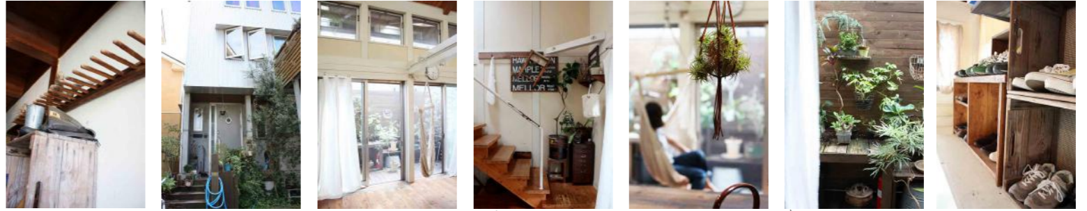
30坪の土地に建てられた30坪のお家です。 真似したくなるコーナーディスプレイ 庭のウッドデッキにはgreenがいっぱい キャベツボックスを靴箱に