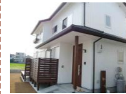
4 years later