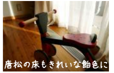
唐松の床もきれいな艶色に