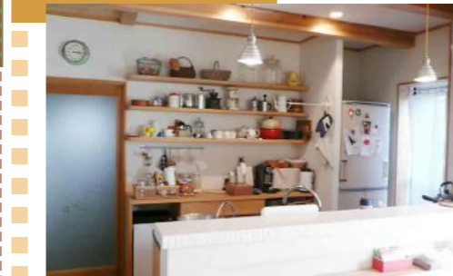
http://blog.800.ne.jp/ktei2009 (施工時のブログです↑)