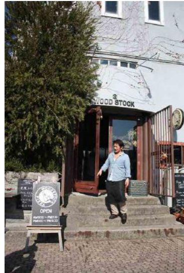
お店の前の大きな大きな プランの木が目印!!

住所 和歌山県田辺市中屋敷町7-1 TEL 0739-24-9812 ブログ http://blog.800.ne.jp/mankichih/ 営業時間 AM11:00~PM2:00 (L.O) PM6:00~PM11:00 (10:30L.O) 定休日 毎週木曜日