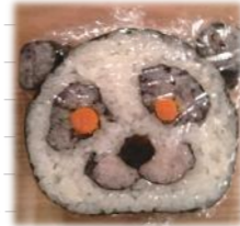
こんなカワイイ お寿司が作れます♪

7月22日(日) PM1:00~ 費用(材料費):1,000円 定員:5名 場所:ふじと台モデルハウス