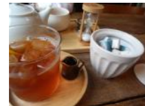
スウェーデンティがオススメ♪