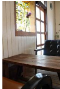
小さな所にもオーナーさんのセンスが