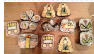
お弁当や、ホームパーティー ちょっぴりいもと違う 楽しいお寿司♪